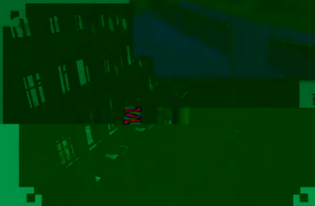
商贸管理类专业 综合训练场所